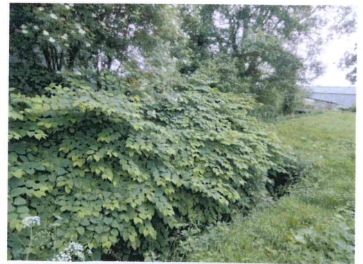
Identification de la renouée asiatique